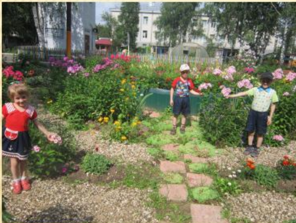
Огород и цветник