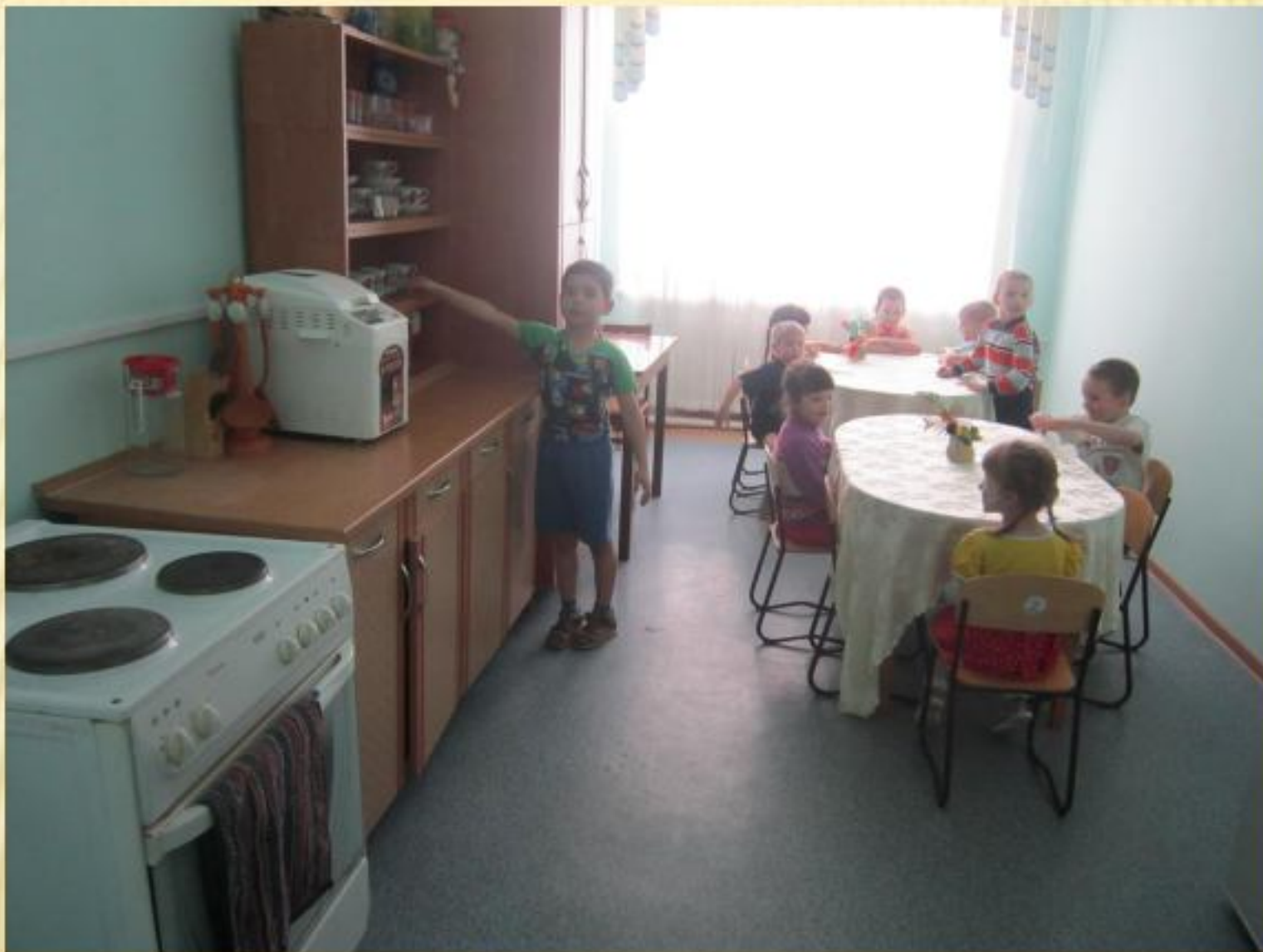
КОМНАТА СОЦИАЛЬНО-БЫТОВОЙ ОРИЕНТАЦИИ