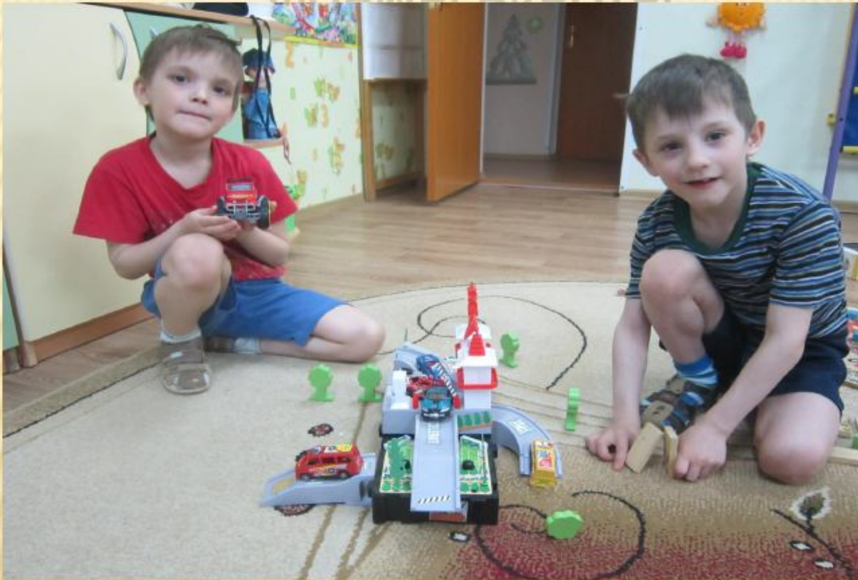
Игровая деятельность детей