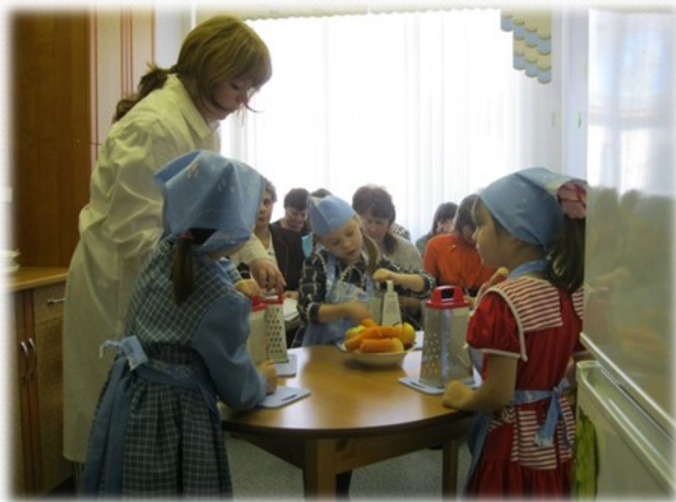
Комната социально-бытовой ориентации